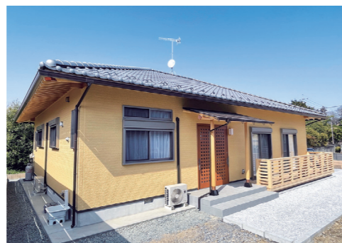
■ 瓦屋根と北山スギの磨き丸太の庇が映える平屋