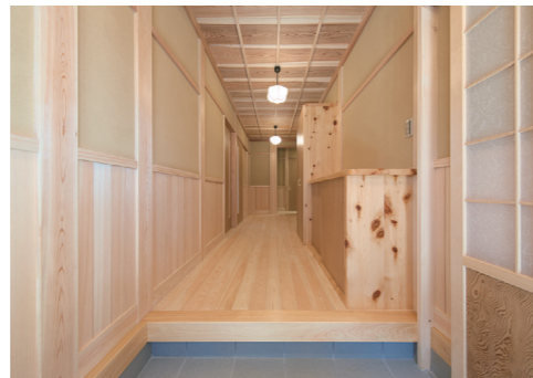
■ 下駄箱の木曽ヒノキをはじめ柱や床、腰板、天井、全て無垢材