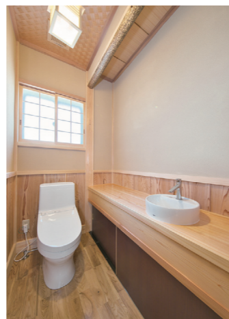
■ トイレも意匠性の高さが光る