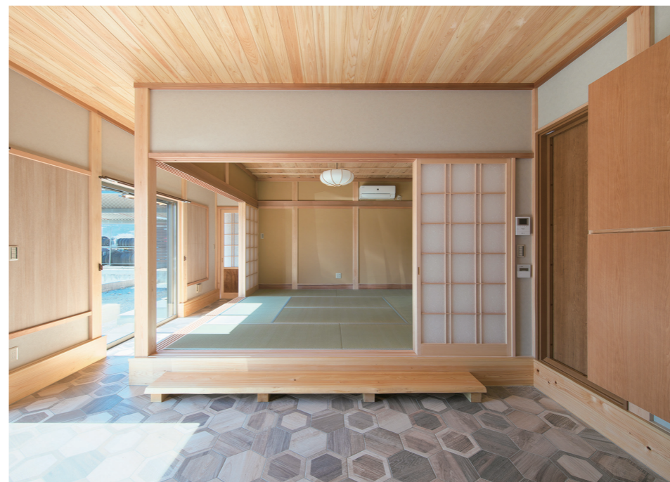
自宅兼事務所内に、くつろぎのスペースとして吉野杉や檜を配した小上がりの和室が備わる。床は、施主こだわりのキングウッドタイルを使用。量とのコントラストで、印象的な空間を生み出している。