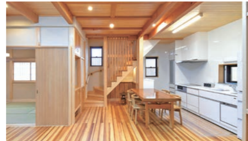
■ダイニングキッチン